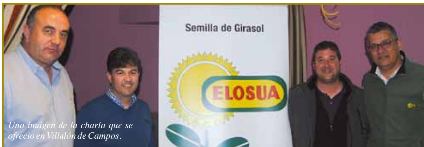
Una imagen de la charla que se ofreció en Villalón de Campos.