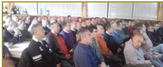
Los agricultores no se quisieron perder las novedades del catálogo de KOIPESOL

Dentro del sistema Granstar, KOIPESOL también tiene soluciones a la desaparición del Linuron. En 2016 lanzó SUBARO con una increíble aceptación a nivel de campo. En su primer año de vida SUBARO ha demostrado ser una de las mejores variedades con tecnología Granstar por su producción y contenido graso. Es una variedad linoleica y de ciclo medio-corto.